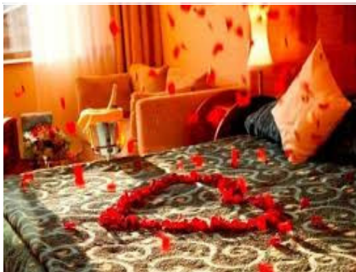
Một không gian lãng mạn, cũng những lời yêu thương ngọt ngào... góp phần làm cho lần đầu thêm thi vị (Ảnh minh họa, nguồn ảnh: Internet)

Dẫu biết rằng có thể xảy ra những chuyện ngoài ý muốn, song bạn cũng có thể tạo ra những ấn tượng cho lần đầu quan hệ tình dục bằng việc thiết lập không gian lãng mạn với ánh nến lung linh, âm nhạc du dương, mùi thơm nhẹ nhàng của loài hoa hai