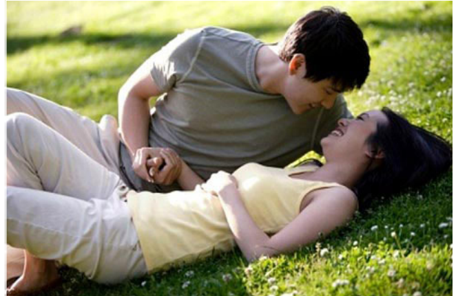
“Chuyện ấy” không chỉ làm theo nhu cầu (hình minh họa)

Lo lắng đấy, nhưng khi vào cuộc sự hấp dẫn, cùng sự ngọt ngào của Mai đã khiến tôi bị đốt cháy hoàn toàn. Khúc dạo đầu trôi qua thật nhanh và tôi quá muốn thực hiện bước tiếp theo. Đang khí thế hùng hục thì đột nhiên “cậu nhỏ” của tôi lại nhũn như con chi chi khi vừa mon men chạm đích.