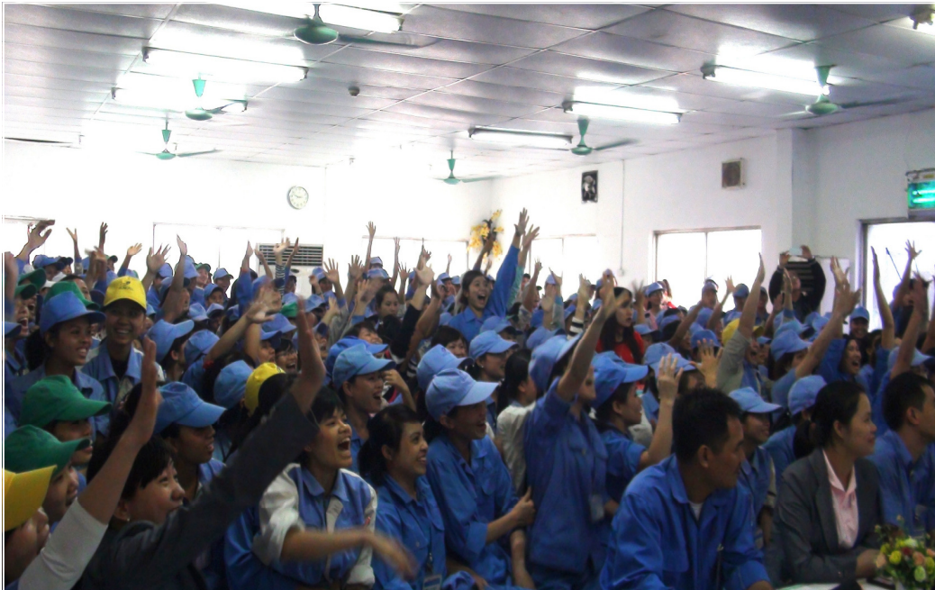
Suncall Việt Nam là một trong số ít những công ty đã thực hiện truyền thông về SKSSTD và khám phụ khoa cho TNCN trong giờ làm việc.

Tại các công ty, doanh nghiệp chưa có cán bộ chuyên sâu làm công tác y tế, tư vấn SKSSTD. Làm thế nào để phủ sóng kiến thức SKSSTD cho TNCN các nhà máy, các KCN là câu hỏi lớn cần lời giải đáp.